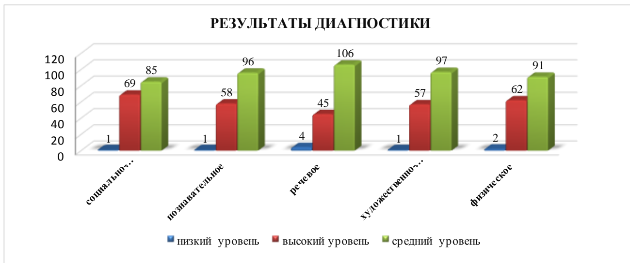
Сравнительная диаграмма результатов педагогической диагностики в 2023-2024 учебном году